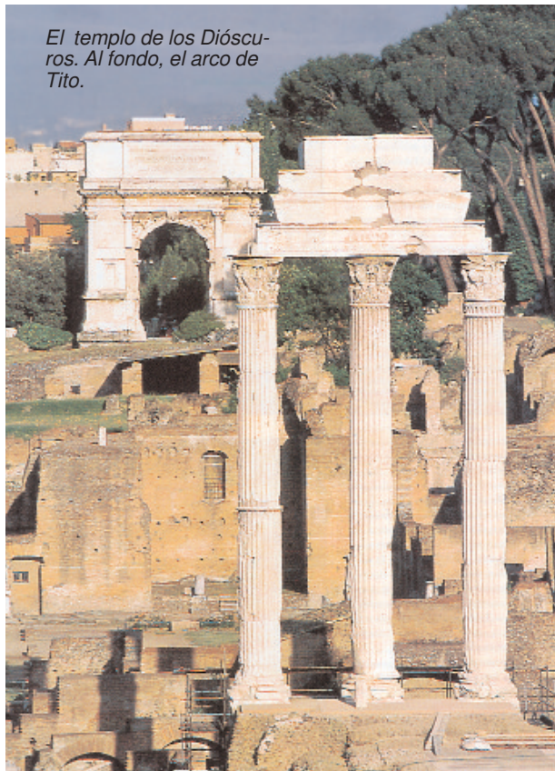
El templo de los Dióscuros. Al fondo, el arco de Tito.

La opinión pública de entonces compartía en gran medida esta llamativa intolerancia hacia los seguidores de Cristo: cuando menos, se juzgaba a los cristianos gente peculiar , que si se esforzaban por ayudar al prójimo, ser fieles en el matrimonio, pagar los impuestos o evitar escrupulosamente todo engaño en los negocios,