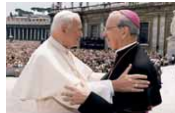
Juan Pablo II y Mons. Álvaro del Portillo, el 18 de mayo de 1992

El 31 de diciembre de 1959, San Josemaría celebró la primera Misa en Santa María de la Paz, que desde la erección del Opus Dei como Prelatura personal pasó a ser la Iglesia Prelaticia. La devoción de Mons. Escrivá a la Virgen es la razón del título de la iglesia y de la imagen que la preside. En la cripta de la Iglesia se encuentran la Capilla del Santísimo