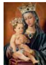
Santa María de la Paz. Retablo

En la cripta está enterrado Mons. Álvaro del Portillo (1914-1994), Obispo y primer sucesor de San Josemaría al frente del Opus Dei. El 5 de marzo de 2004 se inició su Causa de Canonización.