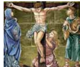
Vía Crucis, XII estación: Cristo en la Cruz. Cerámica

mo y los confesonarios. San Josemaría predicó con incansable celo la necesidad de frecuentar los sacramentos de la Reconciliación y la Eucaristía, dones de Dios a sus hijos los hombres, fuente de paz y de alegría impercedera.