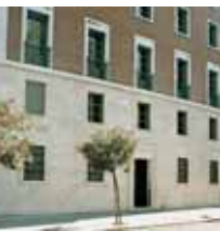
V.le Bruno Buozzi, 75

Santa María de la Paz Iglesia Prelaticia del Opus Dei